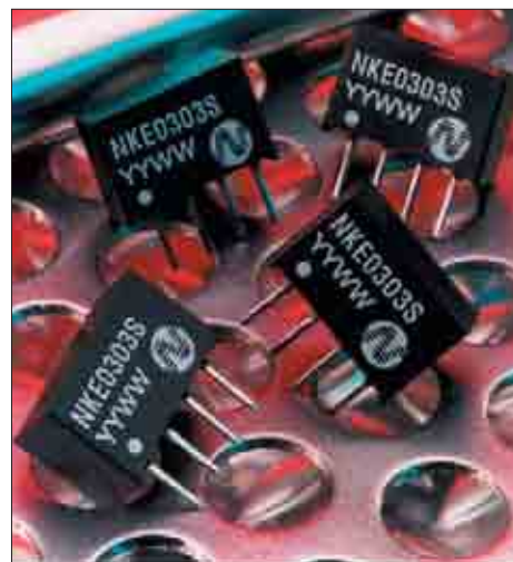
Рис. 1. Серия NKE

Подобные конверторы представлены в основном семействами LME, HPR1XX, HPR4XX,