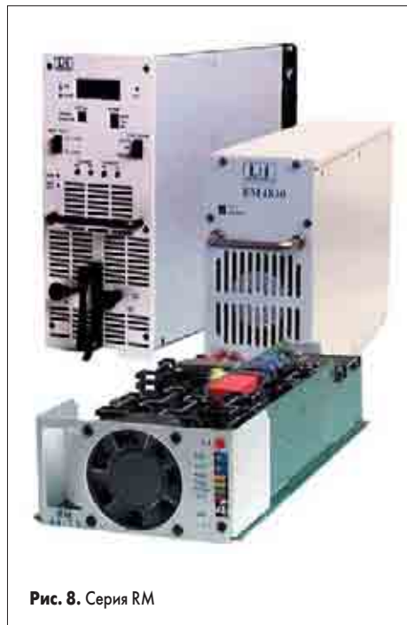
Рис. 8. Серия RM