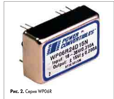
Рис. 2. Серия WP06R

Данные конверторы представлены семействами PWR11XX, PWR13XX, HL02R, NDL, NMH, NML, NMS, NMT, NDY, PWR12XX, HB04U, WP06R. Эти конверторы имеют расположение выводов по общепромышленному стандарту, а также работают в широком диапазоне температур. Кроме того, конверторы снабжены постоянной защитой от перенапряжения и короткого замыкания, а также защитой от перегрева. Некоторые модели обладают опцией удаленного включения-выключения.