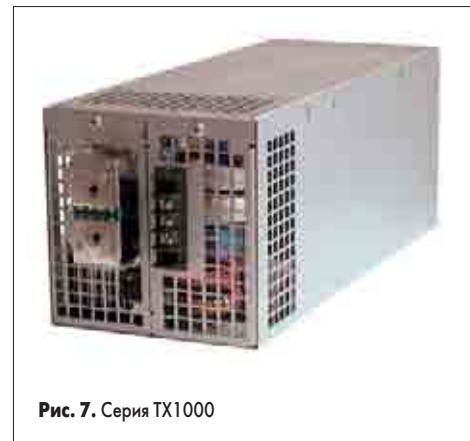
Рис. 7. Серия TX1000

Дополнительную информацию по продукции C&D Technologies вы можете получить на сайтах www.cdnc.com , www.cdpowerelectronics.com и www.semiconductor.ru .