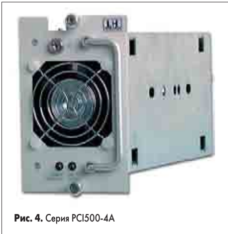
Рис. 4. Серия PCI500-4A

Подобные приборы используются в основном в качестве источников вторичного электропитания. Они представлены следующими сериями: DNX301, DNX350, PCIC350DC, PCI500-4X. Две последние серии предназначены для работы в системах Compact PCI и обеспечивают все необходимые для работы этих систем напряжения.