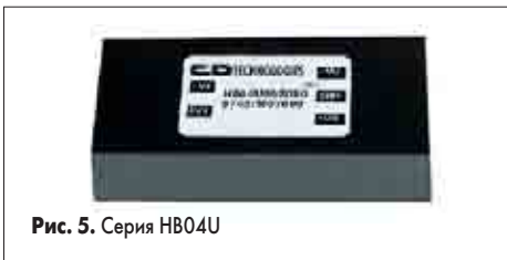
Рис. 5. Серия HB04U

Среди вышеупомянутых конвертеров особо следует отметить такие подгруппы, как конвертеры с высокой изоляцией между входом и выходом (до 8 кВ) — серий NMJ, NMS, HB04U, а также конвертеры для поверхностного монтажа (серии HPR1XX, NTA, NTE, NTV, HL02R), выполненные по технологии производства микросхем (монтаж на рамке), что обеспечивает компланарность выводов ± 0,1 мм.