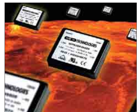
Рис. 3. Серия WPN20R

Эти конверторы представлены следующими семействами: NPH105, WPC10R, NPH15S, WPN20R, NPH25S, VSX40, VKA50, VKA60, VKP60, VSX60, VKA75, VKA100, VKP100, VKA150. Особенностями данных серий являются высокая эффективность (до 89%), наличие дополнительных опций регулировки частоты и выходного напряжения, опция внешнего отключения. Все конверторы имеют стандартную разводку и большинство из них сертифицировано по стандарту UL1950.