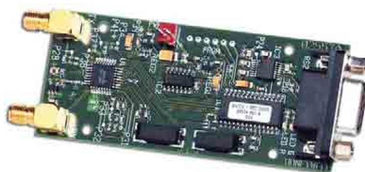
Рис. 5. Плата из набора разработчика HRF-ROC09325

Вышеуказанное программное обеспечение можно использовать не только для связи типа «точка — точка», но и для организации сетей. При этом используется топология «базо-