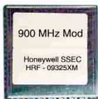
Рис. 4. Радиомодуль HRF-ROC09325XM

Кроме вышеупомянутых трансиверов Honeywell SSEC выпускает еще и законченные модули для передачи данных по радиоканалу. Одним из таких модулей является HRF-ROC09325XM , работающий в диапазоне частот 902–928 МГц и передающий данные со скоростью 19,2 кбит/с. Для того чтобы использовать HRF-ROC09325XM достаточно подключить к нему питание, антенну, управляющий микропроцессор (через интерфейс SPI), а также несколько элементов обвязки (рис. 4).