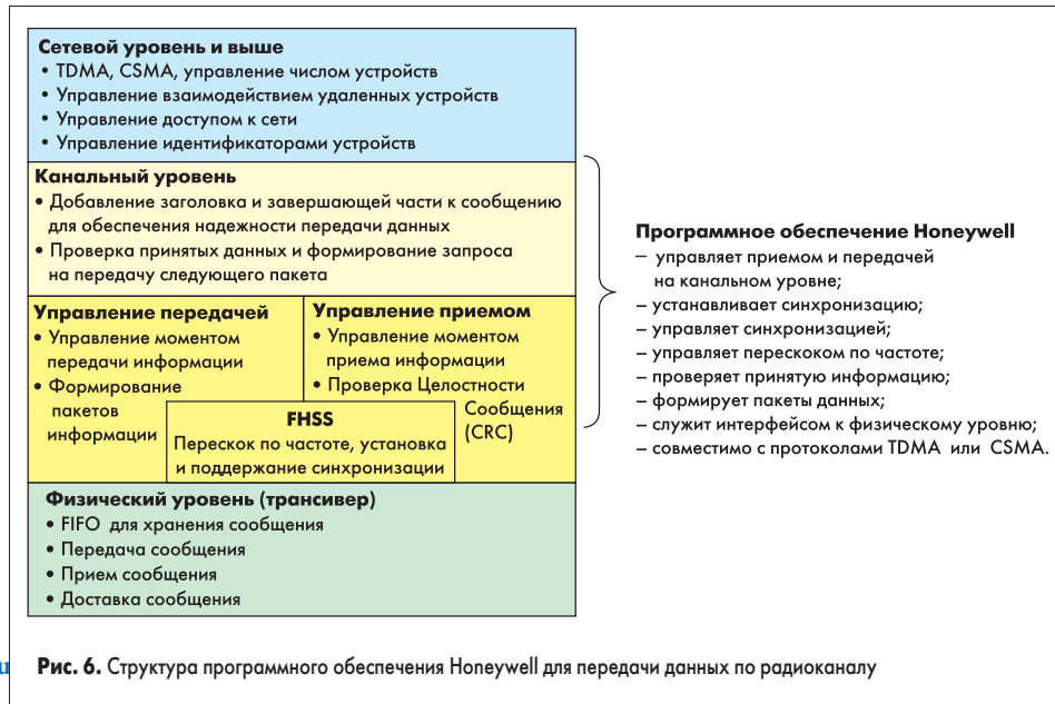
Рис. 6. Структура программного обеспечения Honeywell для передачи данных по радиоканалу

Всю необходимую информацию по продукции Honeywell SSEC можно найти на сайтах www.mysoiservices.com , www.may.ru www.semiconductor.ru .