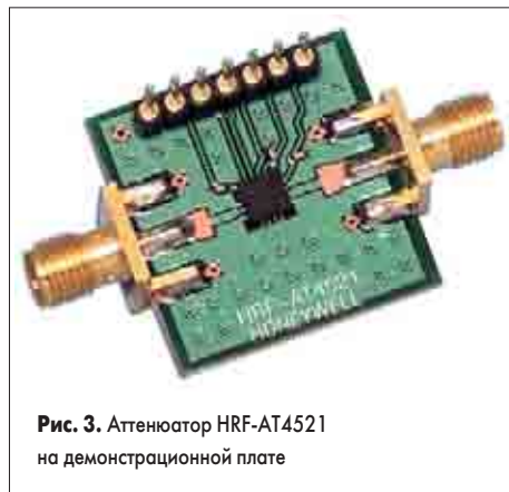
Рис. 3. Аттенюатор HRF-AT4521 на демонстрационной плате

Так же как и для СВЧ-ключей, для аттенюаторов существуют специальные демонстрационные платы, упрощающие процесс макетирования и тестирования создаваемого устройства (рис. 3).